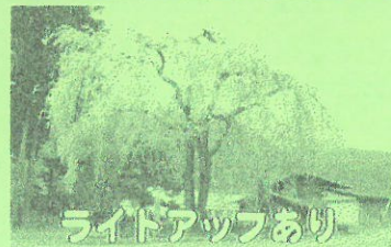
万石地区 薬師堂 枝垂れ桜